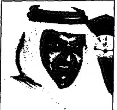
الشيخ حمد بن خليفة

وقرر امير قطر الشيخ حمد بن خليفة آل ثاني امس انه قرر إنشاء اول برلمان منتخب في بلاده من قبله. وقرر ان يكون هذا المجلس اسما «المجلس التشريعي» ويتكون من 31 عضواً من بين 100 الف مواطن في قطر، وذلك وفقاً لقرار امير قطر الشيخ حمد بن خليفة آل ثاني امس. وقرر ان يكون هذا المجلس اسما «المجلس التشريعي» ويتكون من 31 عضواً من بين 100 الف مواطن في قطر، وذلك وفقاً لقرار امير قطر الشيخ حمد بن خليفة آل ثاني امس. وقرر امير قطر الشيخ حمد بن خليفة آل ثاني امس انه قرر إنشاء اول برلمان منتخب في بلاده من قبله. وقرر ان يكون هذا المجلس اسما «المجلس التشريعي» ويتكون من 31 عضواً من بين 100 الف مواطن في قطر، وذلك وفقاً لقرار امير قطر الشيخ حمد بن خليفة آل ثاني امس.